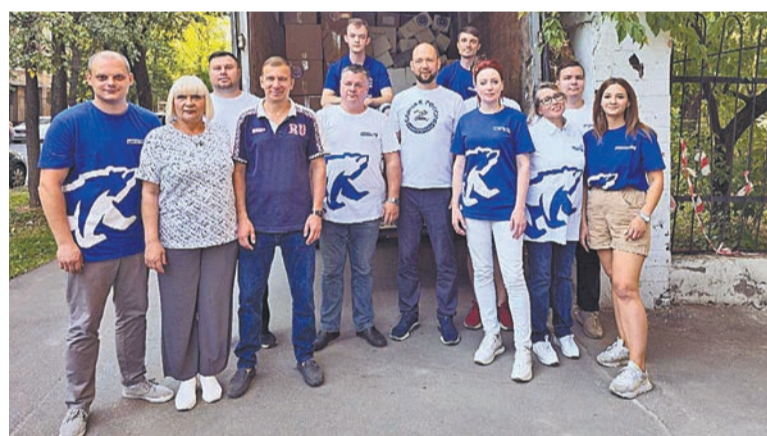
для сбора гуманитарной помощи: ул. Краснодарская, д. 24. Спасибо всем за поддержку! Вместе мы можем сделать больше!

Благодаря муниципальным депутатам, неравнодушным жителям района Люблино, Женскому движению Единой России и исполкому партии Юго-Восточного округа собран очередной гуманитарный груз, который направлен в Курскую область. Удалось собрать более 3,5 тонн груза: бытовая техника, женские, мужские и детские вещи, обувь, канцелярские принадлежности, игрушки, памперсы, влажные салфетки, бытовая химия и многое другое, что может пригодиться в быту на первое время. Отделения партии «Единая Россия» продолжают сбор гуманитарной помощи для наших бойцов, жителей приграничных и новых регионов. Адрес районного отделения партии