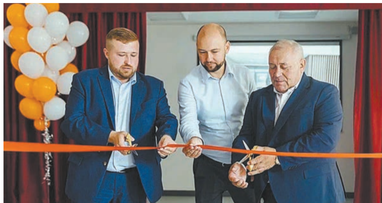
для каждой группы и пешеходные дорожки. Новый детский сад стал настоящим домом для маленьких жителей нашего района.

В районе Люблино в школе имени Ф. М. Достоевского состоялось открытие нового дошкольного корпуса «Умка». Это уникальное образовательное учреждение сочетает лучшие традиции дошкольного образования и современные технологии. В детском саду есть всё необходимое для гармоничного развития и обучения детей: просторные групповые комнаты, спортивный и музыкальный залы, кружковая для дополнительных занятий и бассейн. Собственный пищеблок полного технологического цикла обеспечивает полноценное горячее питание. Территория «Умки» озеленена, созданы индивидуальные площадки